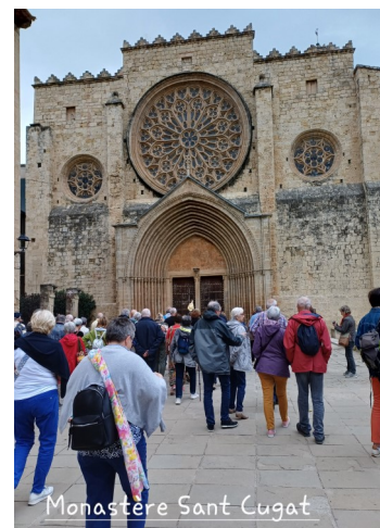
Sortie Bozouls et Estaing le 20 mai