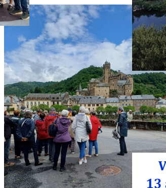
Voyage de l'Amitié 13 au 16 octobre 2025

Pour toute information complémentaire (voyages, activités...), Contacter G. Portes (06 36 22 41 61) ou Francine Fernandez (05 63 71 73 57) Courriel : myosotis81580@gmail.com